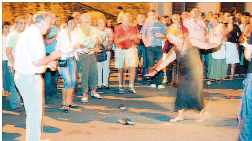
Encouragée par la foule, madame se déchausse et se déhanche...