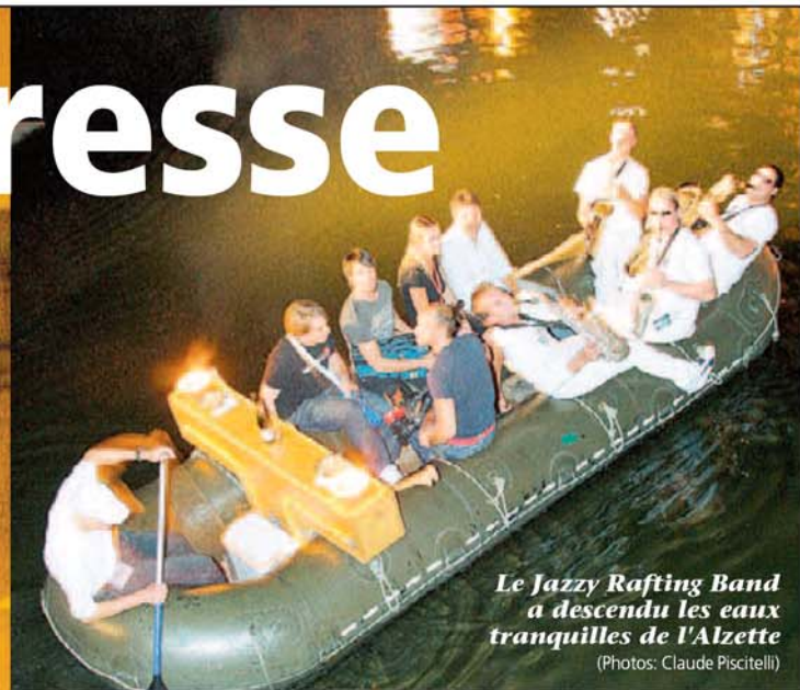
Le Jazzy Rafting Band a descendu les eaux tranquilles de l'Alzette

Blues'n Jazzrallye samedi au Grund et à Clausen. – Près de 25.000 personnes ont fréquenté hier le fameux Blues'n Jazzrallye, qui chaque été à la mi-juillet enflamme les ruelles du Grund et de Clausen.