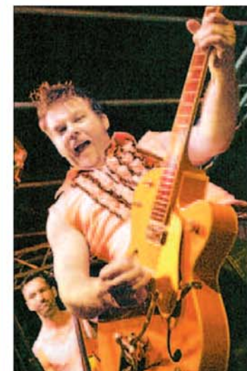
Electrisant coups de riff