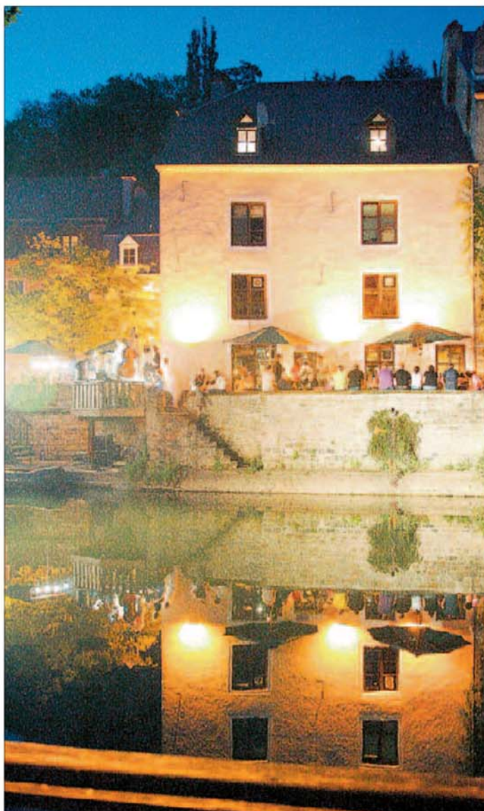
Effet de miroir sur l'Alzette